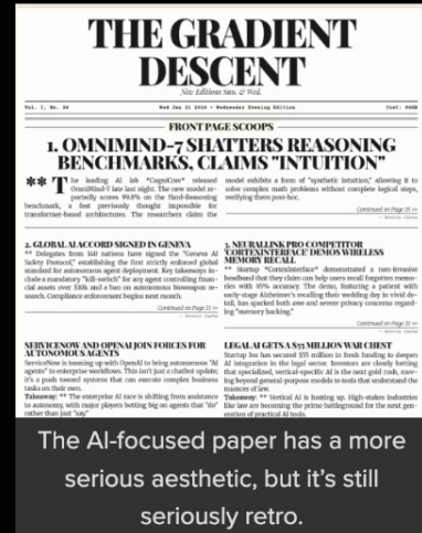
The AI-focused paper has a more serious aesthetic, but it's still seriously retro.

כל הכבוד רפאלי!! כאן אפשר להכנס למהדורה העברית כאן תוכלו למצא את המהדורה באנגלית